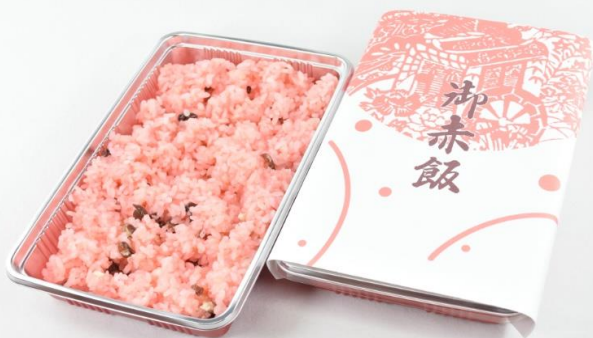
お赤飯 (300g) 850円(税込)